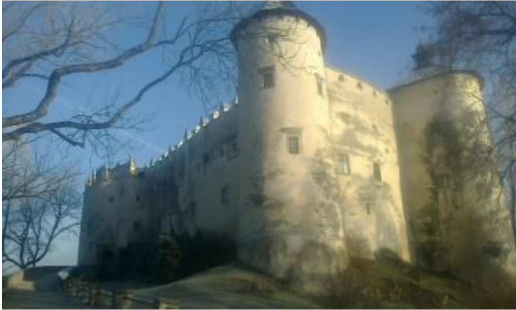
Zobaczyliśmy też zamek w Niedzicy i czorszyńską tamę. Kibicowaliśmy Podhalu Nowy Targ na meczu hokejowym