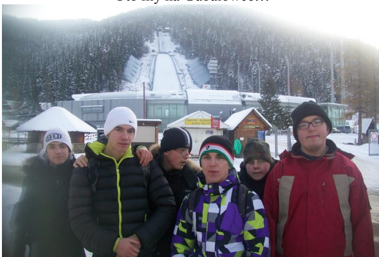
To też my... a za nami Wielka Krokiew !!!